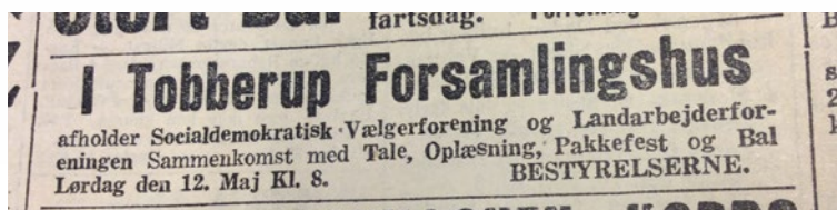
Socialdemokraten 9. maj 1934

Det var tilsyneladende kun en lille del af forsamlingshuset, der var beslaglagt af tyskerne, for gennem hele besættelsen har huset været udlejet. I slutningen af besættelsen har Døstrup Gymnastikforening, Høndrup Boldklub og Hørby